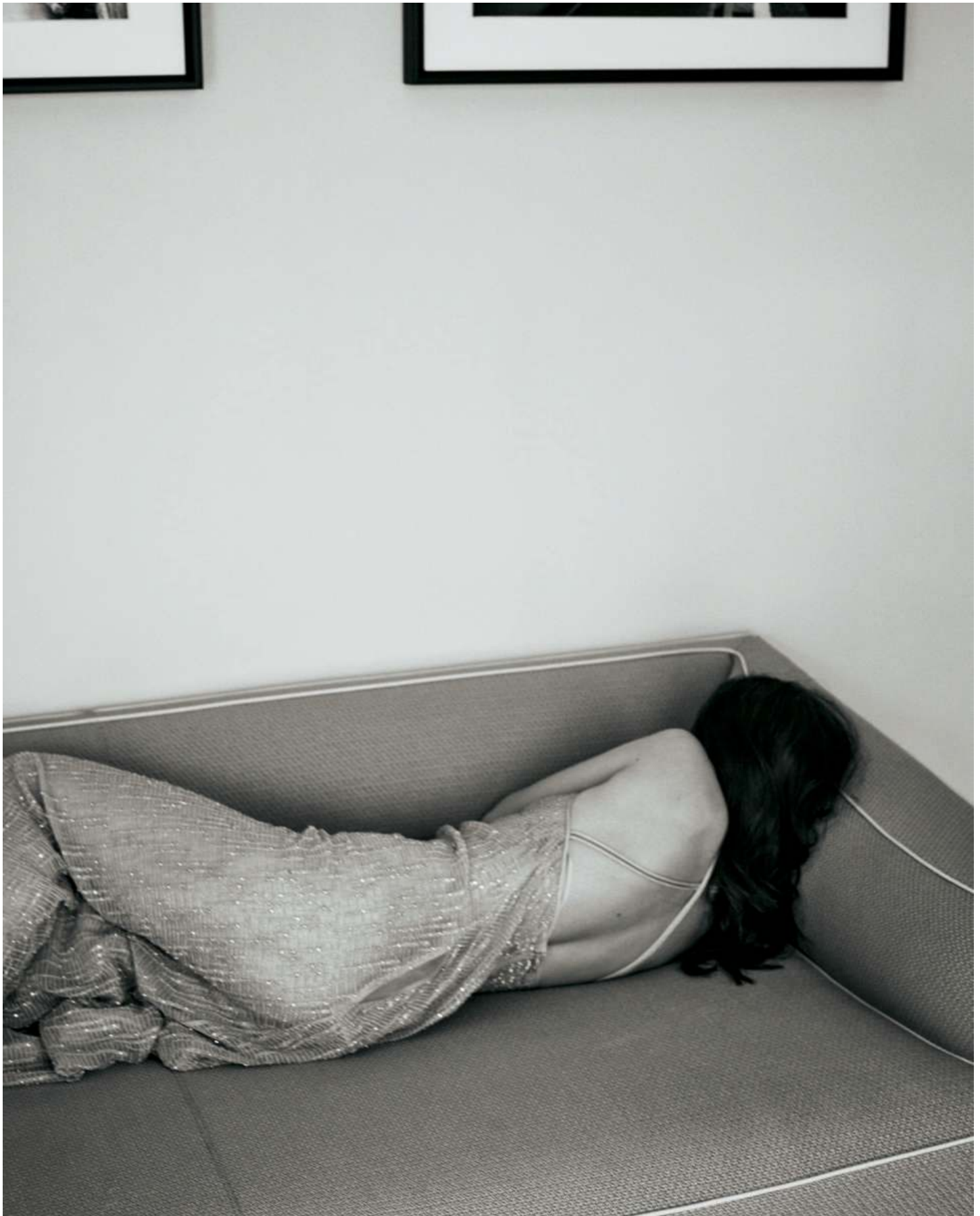
Rückenfreies Kleid mit bestickten Pailletten: Emporio Armani