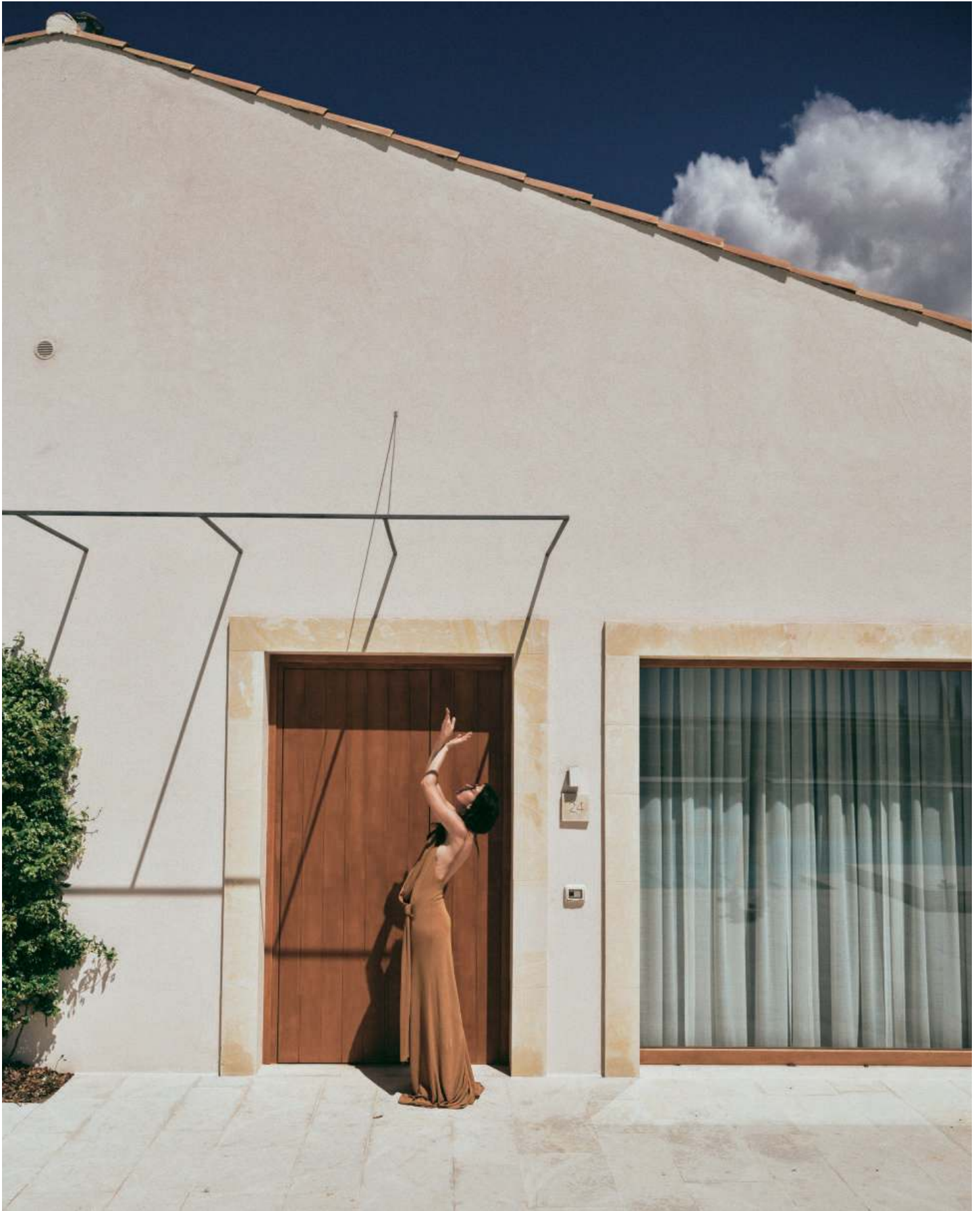
Drapiertes Kleid: Alberta Ferretti