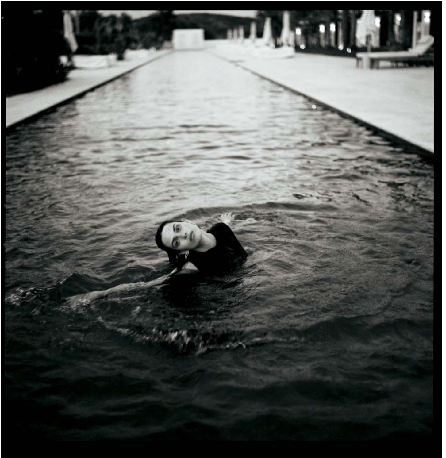
Schwarzes Cut-out-Kleid: Philosophy di Lorenzo Serafini . Ohrringe: Romantico Romantico